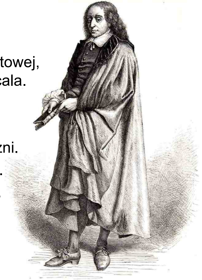
BLAISE PASCAL — Page 667.