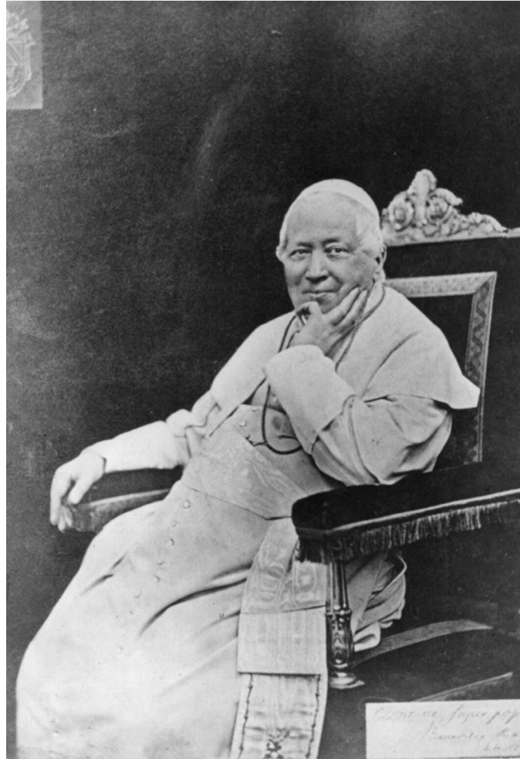
Pius XI, papież w latach 1846-1878