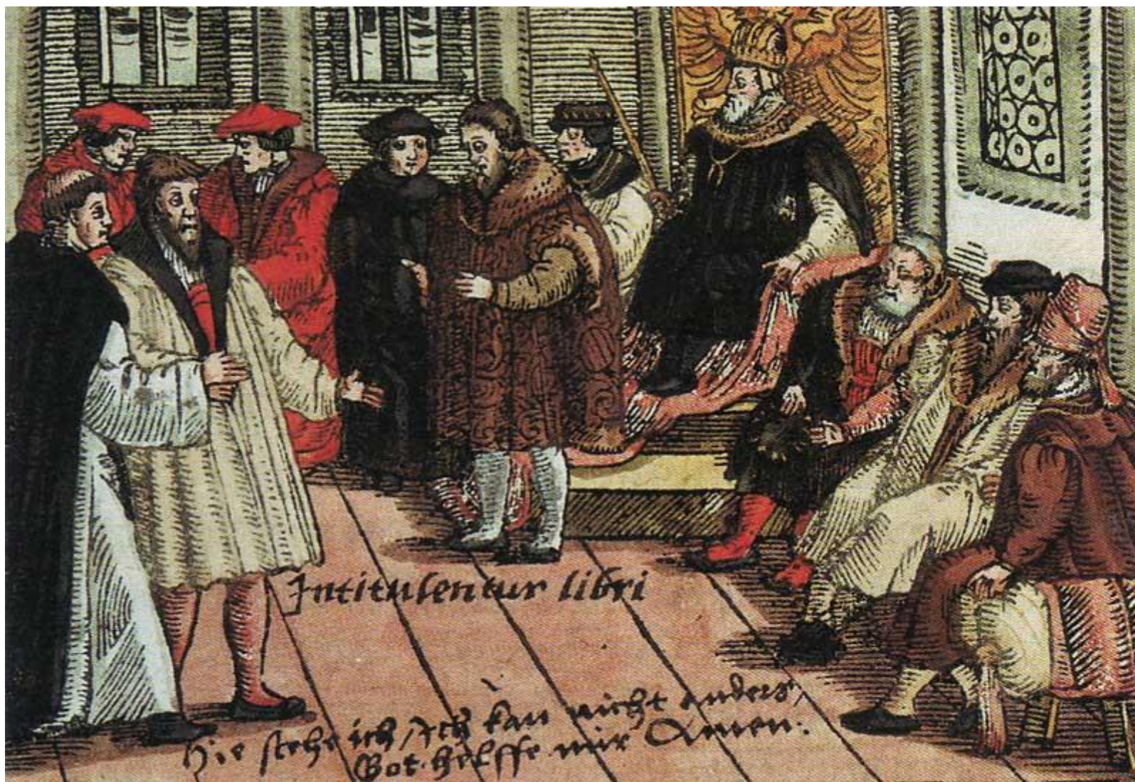
Luter na sejmie w Wormacji (Wikipedia)