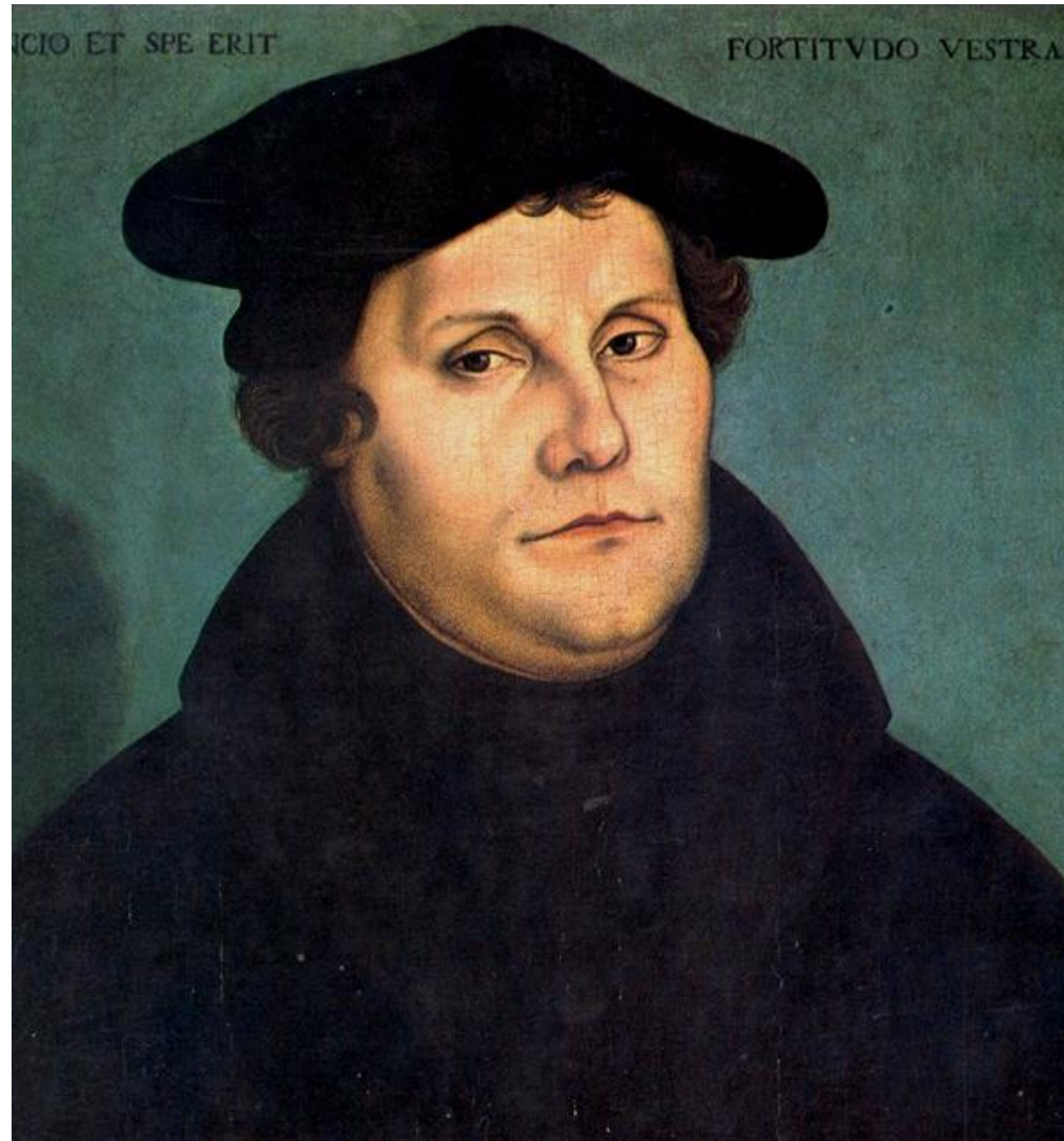
Marcin Luter, Lucas Cranach Starszy