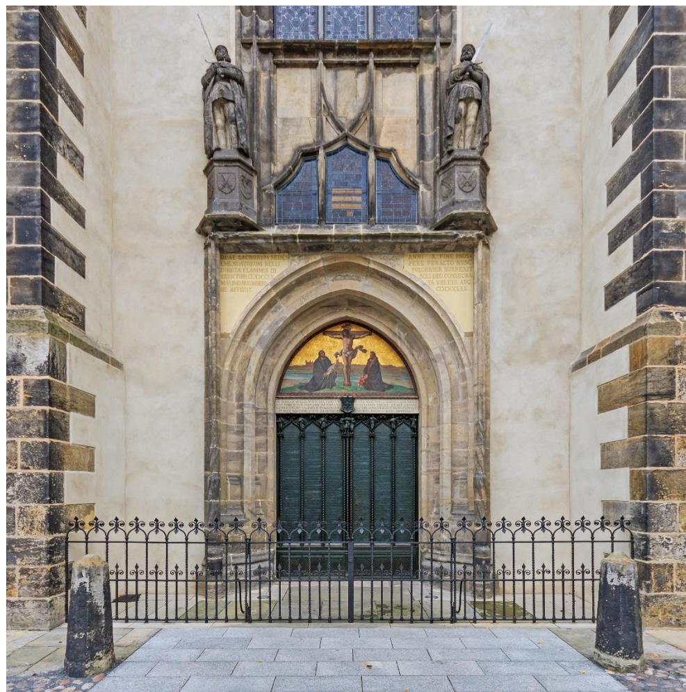
Drzwi kościoła zamkowego w Wittenberdze, na których Marcin Luter miał przybić swoje tezy