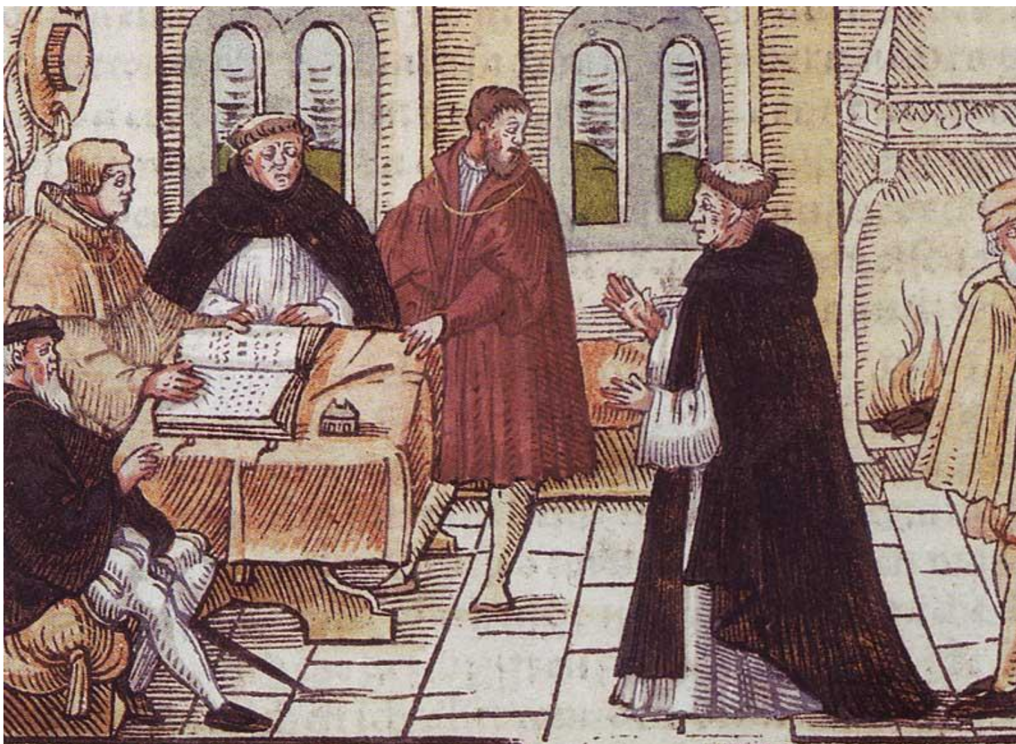
Luter przed Kajetanem