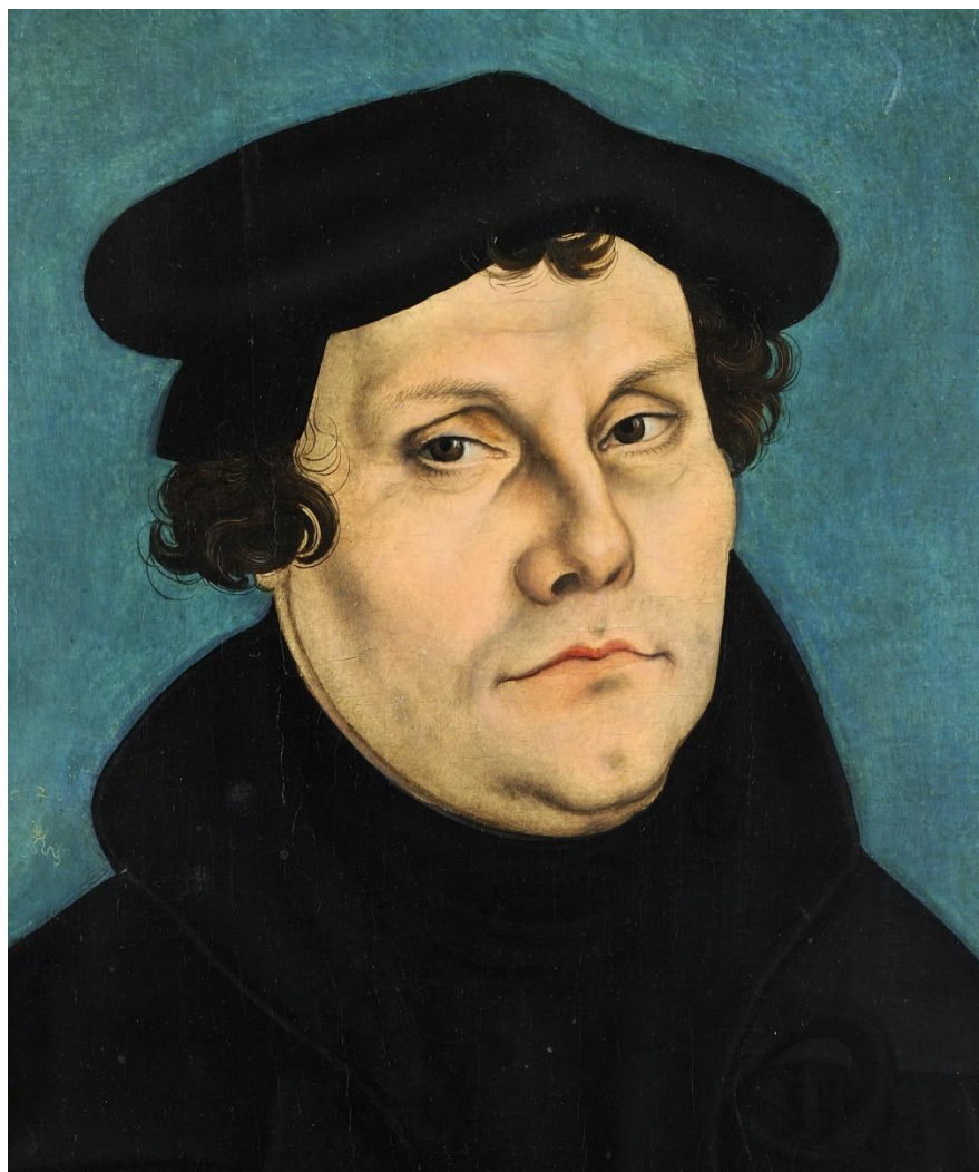
Portret Lutra, autorstwa Lucasa Cranacha Starszego (1528)