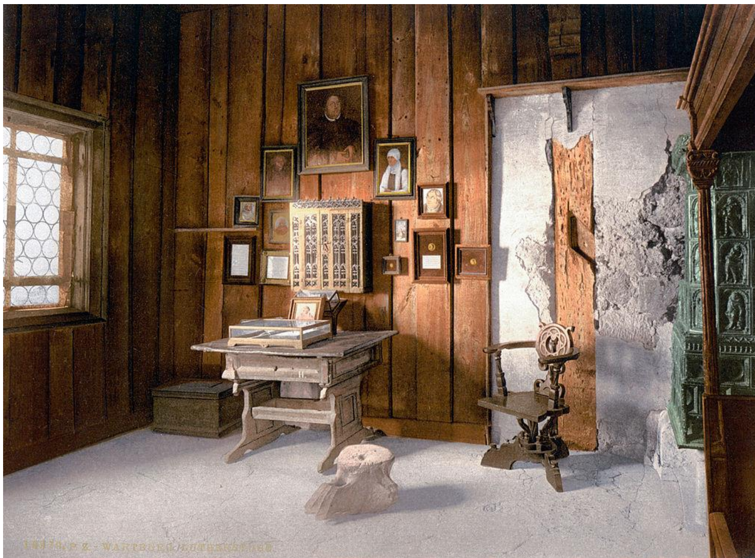
Pokój Lutera na zamku w Wartburgu (Wikipedia)