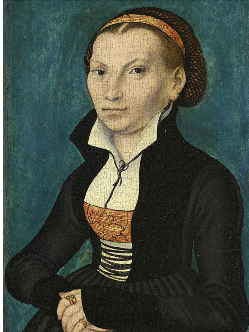
Katarzyna von Bora, Lucas Cranach Starszy