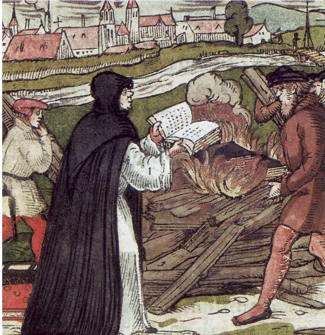
Luter palący bullę papieską