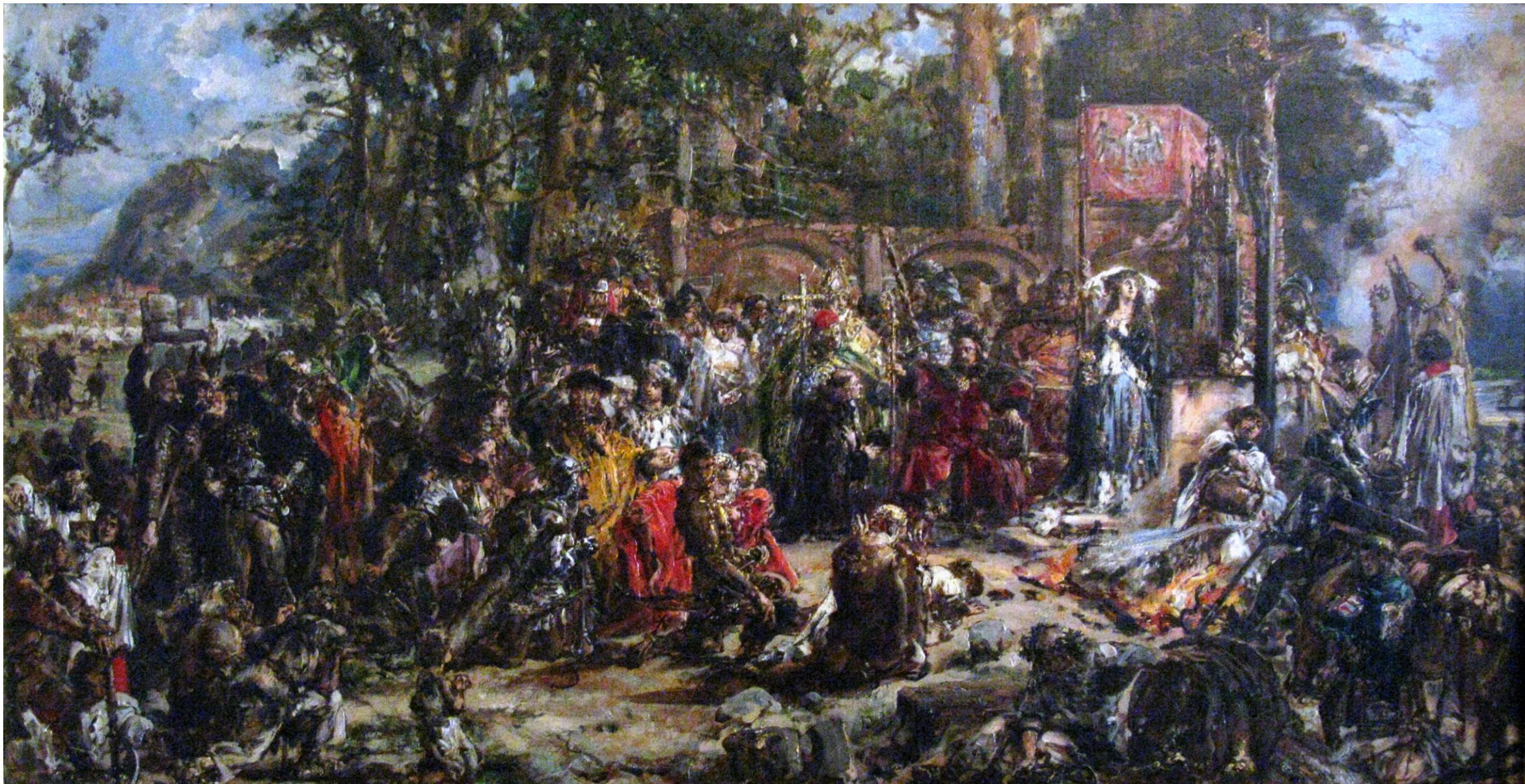
Jan Matejko, Chrzest Litwy (1888 r.).