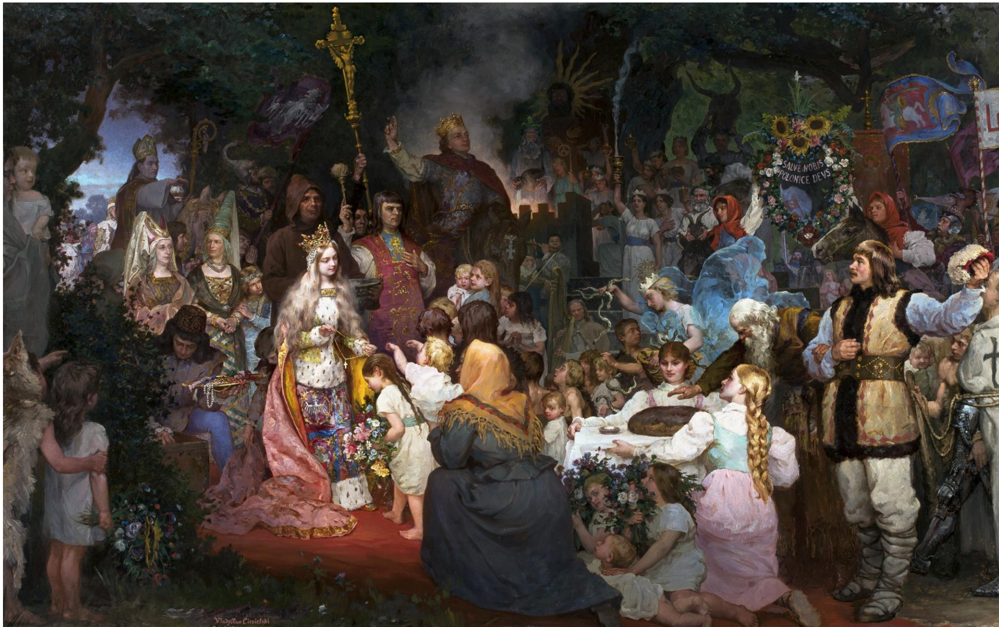
Władysław Ciesielski, Chrzest Litwy (1900 r.).